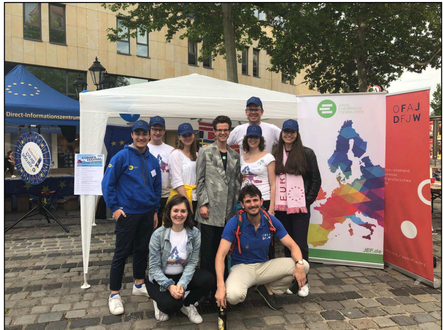
Die JEF bei ihrem Einsatz am Europafestival in Nürnberg.

Während der Landesvorstand noch an eigenen Anträgen arbeitet, möchte ich gerne Euch, die Ihr Euch an den verschiedensten Stellen und mit den unterschiedlichsten thematischen Schwerpunkten für Europa einsetzt, dazu auffordern, mit eigenen Anträgen den JEF-Diskurs mitzugestalten.